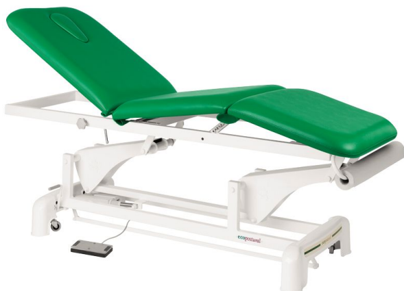
Table 3 plans Ecopostural