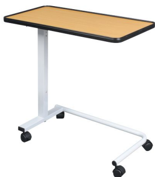
Table de lit Corfou